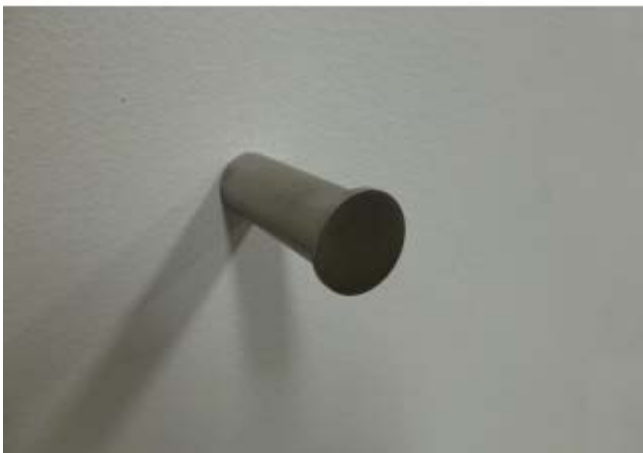
Imagem e Desenho Técnico:

(NOTA) A força suportada dependerá do tipo de parede em que será aplicada. Periodicamente deverá ser verificada a fixação.