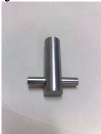
Imagem e Desenho Técnico

(*) Nota: a força suportada pelo cabide dependerá do tipo de parede e da fixação utilizada.