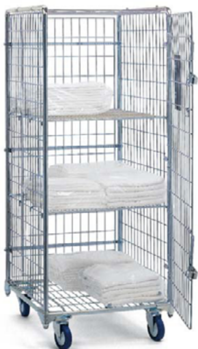
ROLL LINGE SECURITY 10