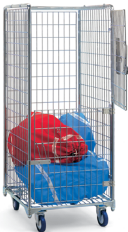
ROLL LINGE SECURITY 250