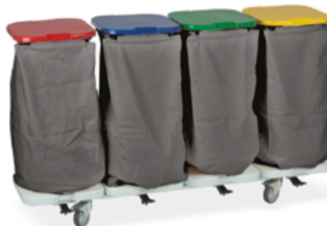
TRISAC ALU 3