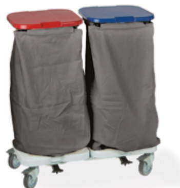
TRISAC ALU 2