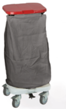
TRISAC ALU 1