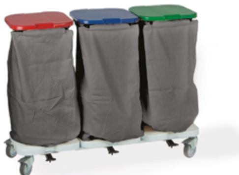
TRISAC ALU 3